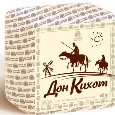
Дон Кихот Де Ла Манча