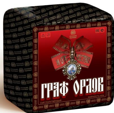
Граф Орлов Фаворит Императрицы