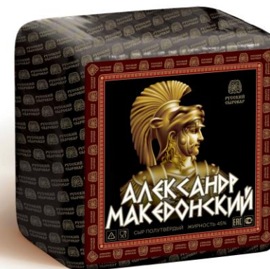
Александр Македонский Великий